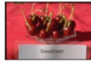
スウィートハート種